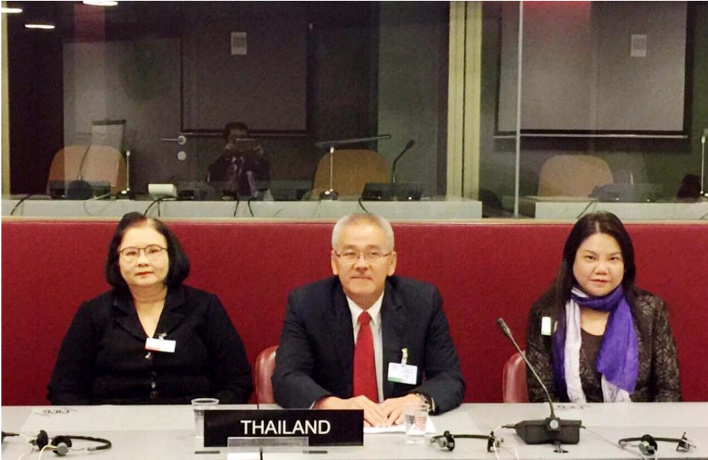
คณะผู้แทนไทยนำโดยนางสายทิพย์ เชาวลิขิตถวิล รองเลขาธิการสภาผู้แทนราษฎร เข้าร่วมการประชุมสมาคมเลขาธิการรัฐสภา ณ นครเจนีวา สมาพันธรัฐสวิส