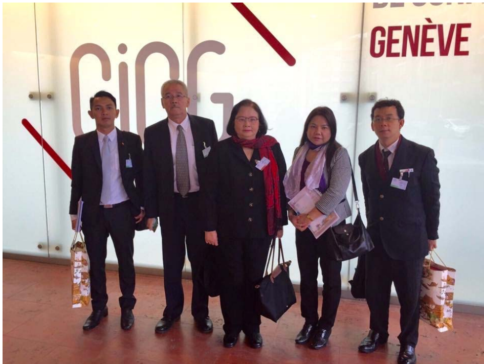
คณะผู้แทนไทยร่วมกันถ่ายภาพ ณ ศูนย์ประชุมนานาชาติ นครเจนีวา ซึ่งเป็นสถานที่จัดการประชุมสมาคมเลขาธิการรัฐสภา