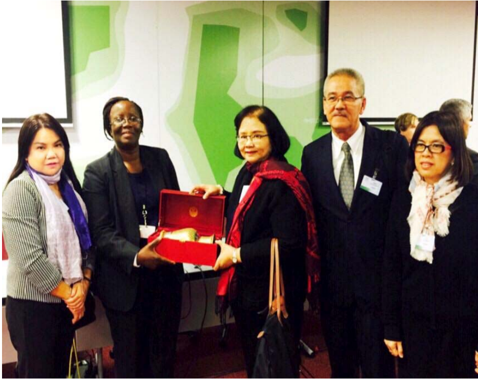
นางสายทิพย์ เขาวลิตถวิล รองเลขาธิการสภาผู้แทนราษฎร และหัวหน้าคณะผู้แทนไทย มอบของที่ระลึกแก่นางดอริส คาไท คาเทเบ มวิงกา (Doris K. Mwinga) ประธานสมาคมเลขาธิการรัฐสภา