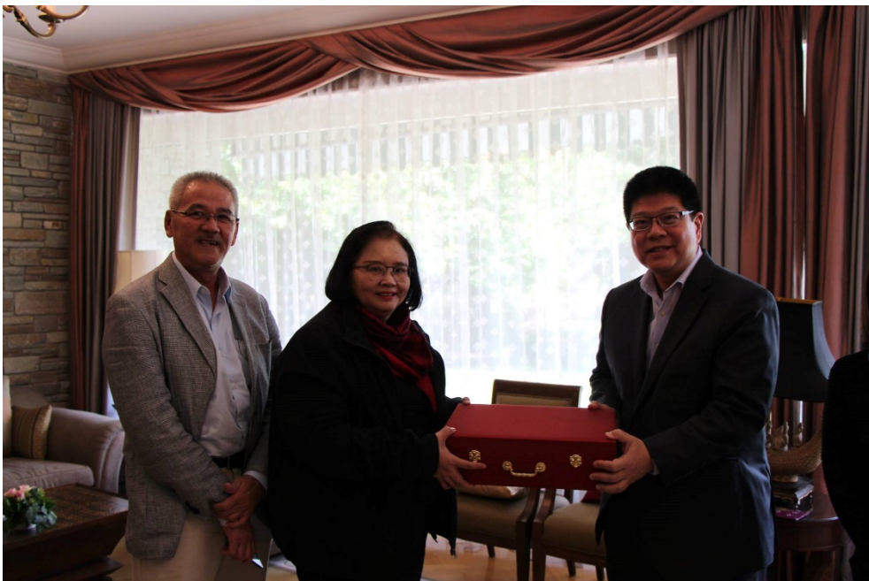
นางสายทิพย์ เขาวลิตถวิล รองเลขาธิการสภาผู้แทนราษฎร และหัวหน้าคณะผู้แทนไทย มอบของที่ระลึกแก่นายธานี ทองภักดี เอกอัครราชทูตผู้แทนถาวรไทย ประจำสหประชาชาติ ณ นครเจนีวา